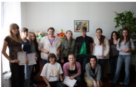
grupa volontera školske godine 2008/2009

UČENICI-KORISNICI - učenici osnovnoškolske dobi, od 5. - 8. razreda (iznimno i niže) koji imaju poteškoće u učenju koje nisu vezane uz neke poteškoće u razvoju. Učenike u program prijavljuju roditelji koji potpisuju izjavu da se slažu da dijete sudjeluje u programu.